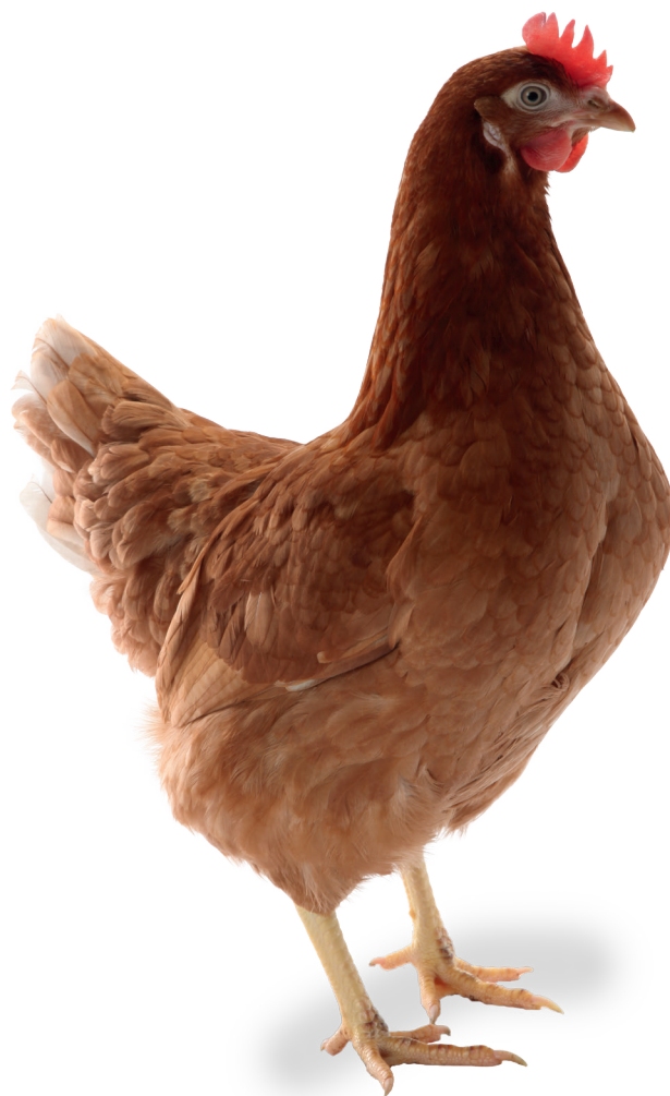
TABLEAU DE PRODUCTION PRODUCTION EN CAGE