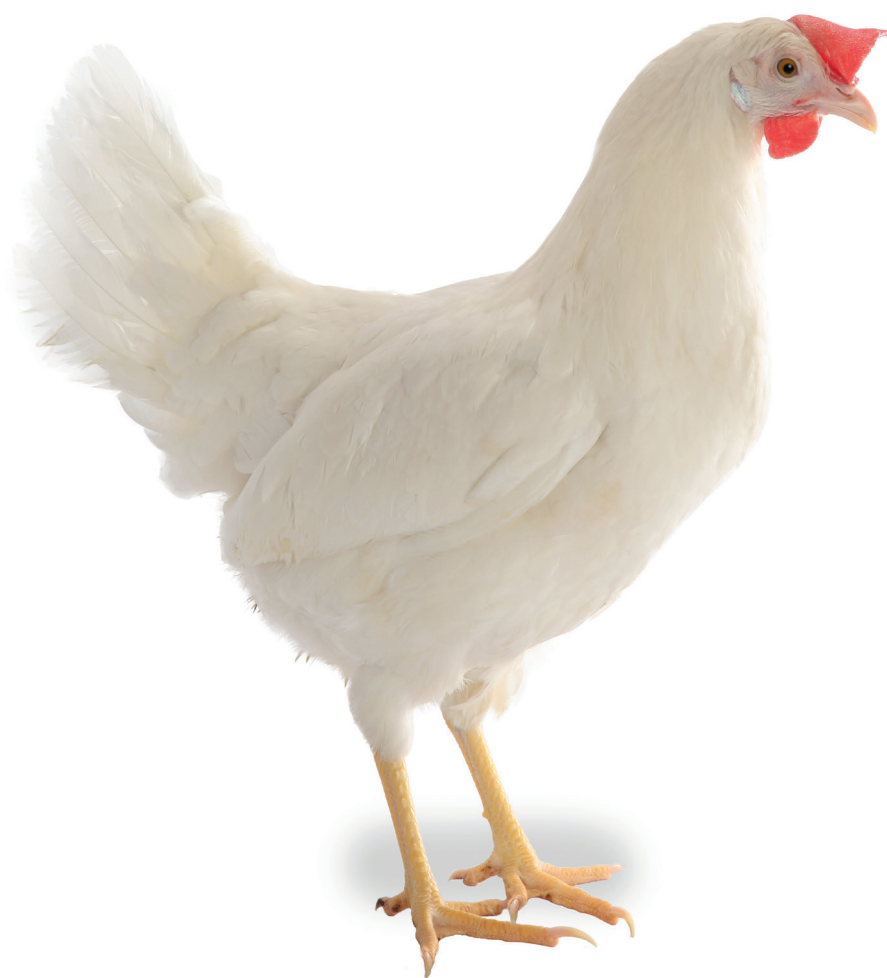
TABLEAU DE PRODUCTION PRODUCTION EN CAGE