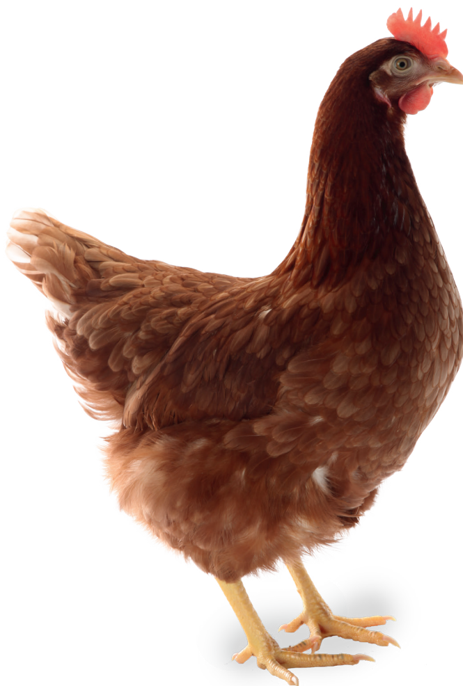
TABLEAU DE PRODUCTION PRODUCTION ALTERNATIVE