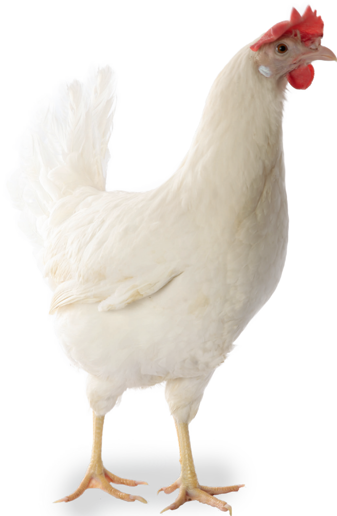
TABLEAU DE PRODUCTION PRODUCTION ALTERNATIVE