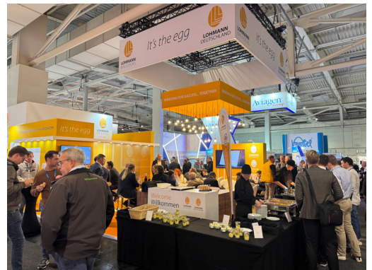
WORLDWIDE | EuroTier 2024: La exitosa feria líder mundial proporciona un impulso relevante para los negocios