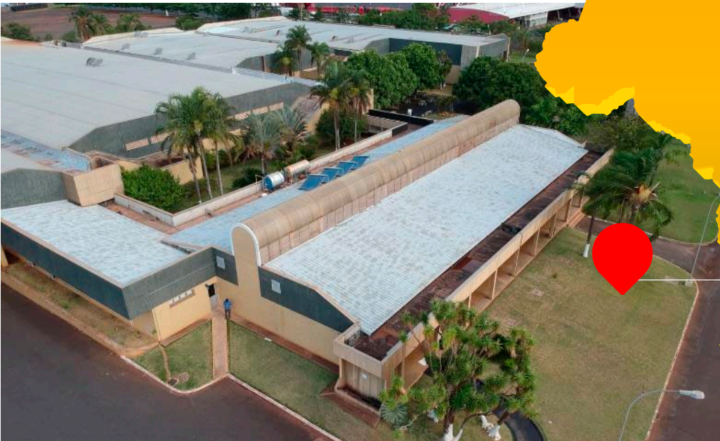
▲ Vista aérea de Incubadora Novo Mundo desde Planalto Postura.

Minas Gerais, un estado en Brasil rico en oro y otras gemas, tiene una historia arraigada en su nombre, que significa “Minas Generales”. Esta región, que una vez fue una fuente importante de oro y plata durante la era colonial de Brasil, ahora es hogar de otro tesoro: la Incubadora Novo Mundo, operada por Planalto Postura, que acaba de celebrar su 30 aniversario.